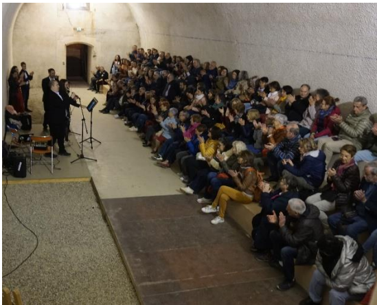
Le groupe Am'Artiste et la chanson française

Soirée du 6 avril, couplant visite nocturne et chansons françaises interprétées par le groupe Am'Artiste, une centaine de spectateurs ont participé aux « Déambulations Musicales » du Fort, une animation de l'Association, gratuite ouverte à tous.